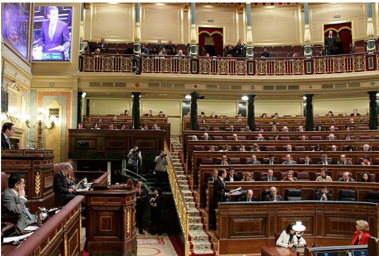
Foto del Congreso por dentro.