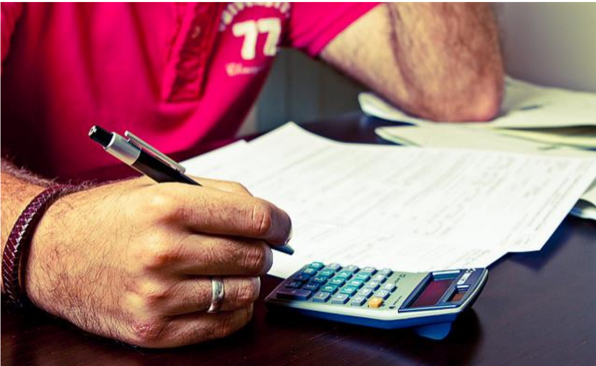
Foto: una persona hace cuentas.

Una vez al año, todo el mundo hace cuentas con su dinero.